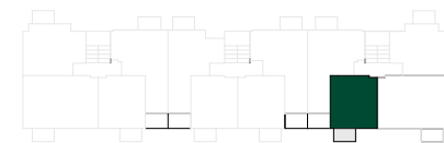
RZUT I PIĘTRA BUDYNEK B2