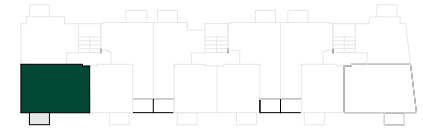
RZUT I PIĘTRA BUDYNEK B2