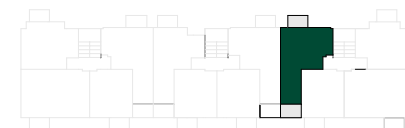
RZUT II PIĘTRA BUDYNEK B2

Niniejsza broszura nie stanowi oferty w rozumieniu przepisów kodeksu cywilnego. Przedstawione rzuty mają charakter poglądowy. Ostateczna powierzchnia mieszkania może ulec nieznacznej zmianie podczas realizacji. Powierzchnia pomieszczeń lub ich części o wysokości w świetle równej lub większej od 2,20m została policzona w 100%, o wysokości równej lub większej od 1,40m lecz mniejszej od 2,20m - w 50%, natomiast o wysokości mniejszej od 1,40m pominięta całkowicie. Ściany możliwe do demontażu przedstawiono na rysunku jako ściany z szarym wypełnieniem. Wszystkie elementy wyposażenia meblarskiego użyte są wyłącznie na potrzeby wizualizacji proponowanych pomieszczeń.